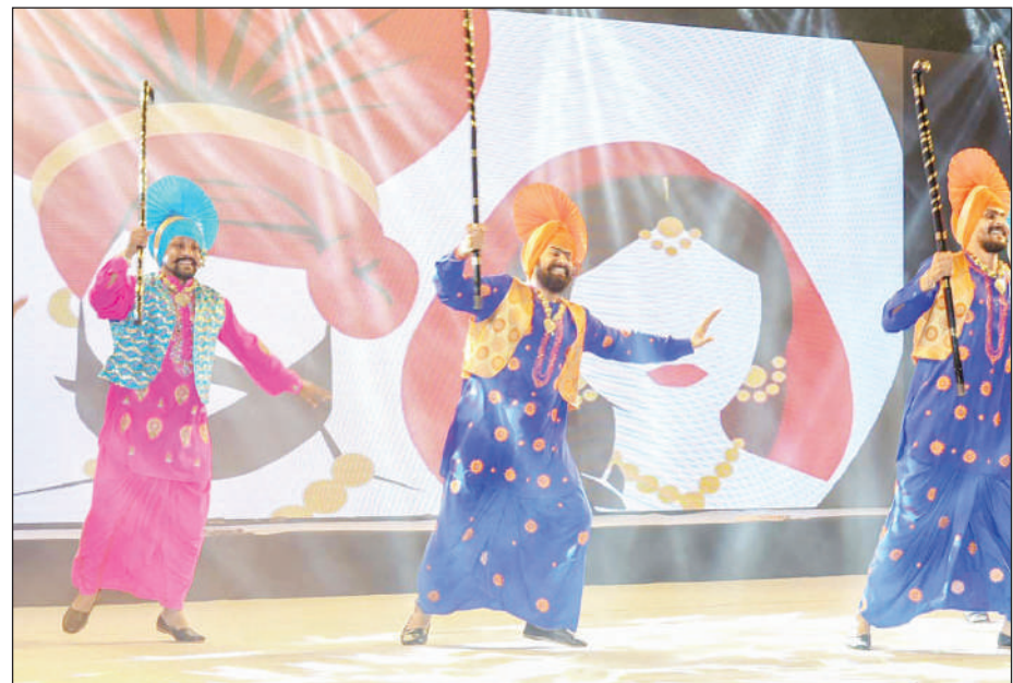
8वें ब्रिक्स इंटरनेशनल कॉम्प्यूटेशन कॉन्फ्रेंस में सांस्कृतिक कार्यक्रम पेश करते कलाकार।

टीएम एक्शन इंडिया/नई दिल्ली दिल्ली के उद्योग नगर मेट्रो स्टेशन के पास वाले इलाके में शुक्रवार सुबह उस वक्त हड़कंप मच गया जब यहां स्थित एक प्लास्टिक फैक्ट्री में भीषण आग लग गई। न्यू एजेंसी एनआई के मुताबिक, आग लगते ही इसकी सूचना तुरंत दमकल विभाग को दी गई जिसके बाद दमकल की कई गाड़ियां मौके पर पहुंची हैं। मौके पर दमकल के कुल 26 वाहन पहुंचे हैं और आग बुझाने का प्रयास कर रहे हैं। अब तक इस मामले में किसी तरह की जनहानि की खबर नहीं है। दमकल विभाग के एक अधिकारी के मुताबिक आग सुबह करीब 6.01 बजे प्लास्टिक का दाना बनाने वाली फैक्ट्री में आग लगने की सूचना मिली।