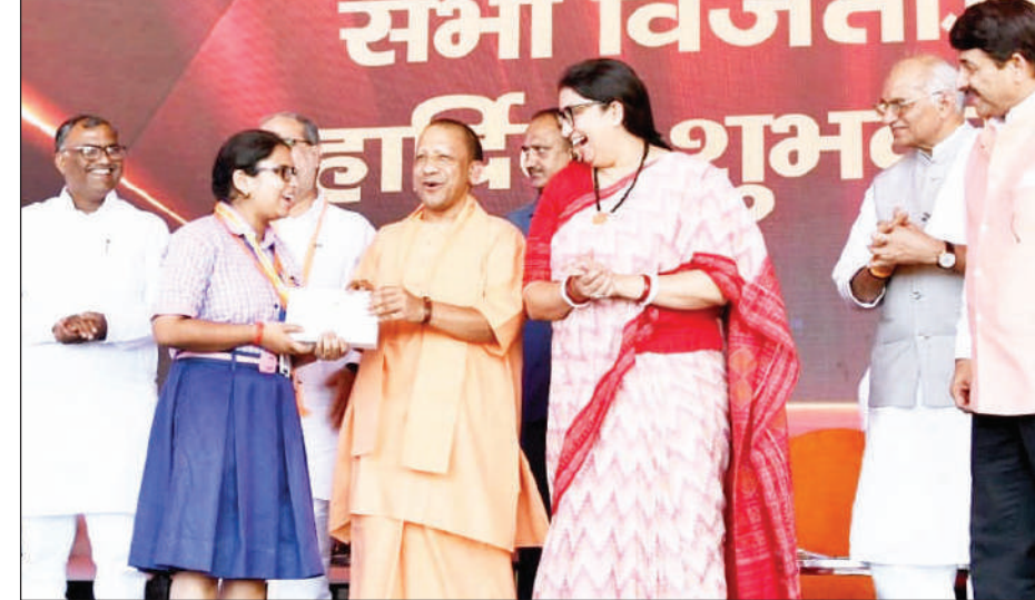
यूपी के मुख्यमंत्री योगी आदित्यनाथ शुक्रवार को अमेटी में 'सांसद खेल-कूद प्रतियोगिता-2023' के विजेता खिलाड़ियों को पुरस्कार वितरण करते हुए।

दोनों डिप्टी सीएम को सीएम काम नहीं करने दे रहे हैं। यही उनका दर्द है जिसे हमने सामने रख दिया।