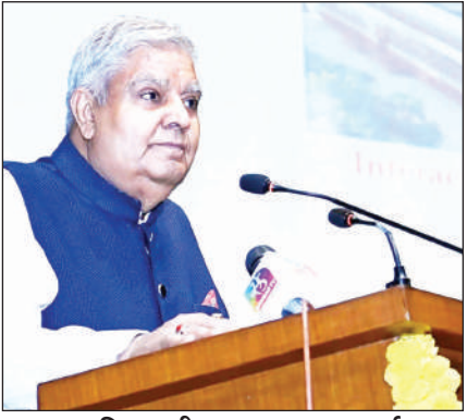
उपराष्ट्रपति जगदीप धनखड़ एक कार्यक्रम को संबोधित करते हुए।