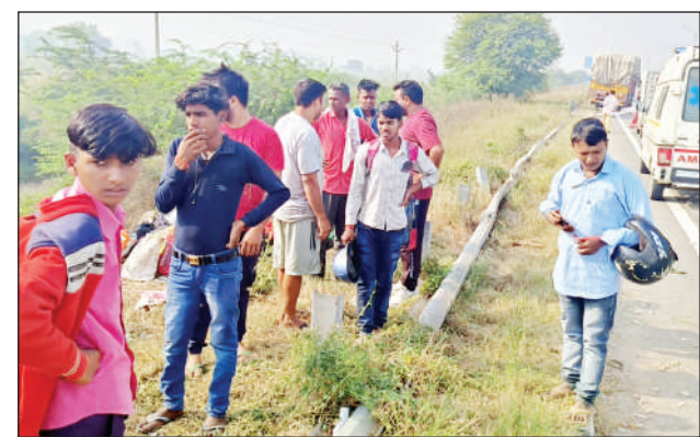
लोगों की मौत हुई है। जिनका सोनीपत के सिविल अस्पताल में

खरखौदा/सोनीपत/सोमपाल सैनी शुक्रवार की सुबह खरखौदा के केएमपी पर सड़क हादसे में 5 लोगों की जान चली गई और दो दर्जन के करीब लोग गंभीर रूप से घायल हुए हैं। आपकों बत दे कि ये हादसा केएमपी पर खड़े पिकअप को पीछे से आ रहे कैटर ने टक्कर मार दी। जिससे ये हादसा हुआ है। हादसे में पिकअप में सवार लोग गंभीर रूप से घायल हो गए। जिससे चारों तरफ चीख पुकार मच गई। आज हादसे में 5