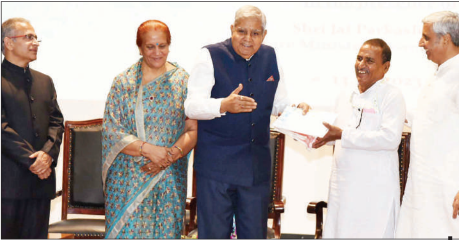
उपराष्ट्रपति जगदीप धनखड़ संसद भवन में आए हरियाणा के किसानों को सम्मानित करते हुए। इस मौके पर हरियाणा के कृषि मंत्री जेपी दलाल भी मौजूद रहे।

नई दिल्ली। कांग्रेस पांच राज्यों के आगामी विधानसभा चुनावों को लेकर लगातार बैठक कर रही है। इसी क्रम में मध्य प्रदेश विधानसभा चुनाव को लेकर शुक्रवार को कांग्रेस की केंद्रीय चुनाव समिति (सीडब्ल्यूसी) की पार्टी मुख्यालय में बैठक हुई। बैठक के बाद मध्य प्रदेश कांग्रेस अध्यक्ष कमलनाथ ने मीडिया से बातचीत करते हुए कहा कि आज बैठक में मध्य प्रदेश विधानसभा की 60 सीटों को लेकर चर्चा हुई है। फिलहाल कोई निर्णय नहीं लिया गया है। आने वाले दिनों में पुनः इस विषय पर सीडब्ल्यूसी की बैठक होगी। कमलनाथ ने कहा कि कांग्रेस पितृ पक्ष के बाद ही उम्मीदवारों की अपनी पहली लिस्ट जारी करेगी। मध्य प्रदेश कांग्रेस प्रभारी रणदीप सिंह सुरजेवाला ने कहा कि आज केंद्रीय चुनाव समिति की बैठक कांग्रेस मुख्यालय दिल्ली में आयोजित की गई। इस दौरान मध्य प्रदेश विधानसभा चुनाव और उम्मीदवारों को लेकर चर्चा हुई। इस बैठक में कांग्रेस अध्यक्ष मल्लिकार्जुन खड़गे, पूर्व पार्टी अध्यक्ष राहुल गांधी सहित अन्य पार्टी पदाधिकारी मौजूद रहे।